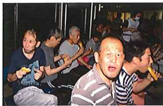
モナカアイス食べました! 美味しかった(#^.^#)