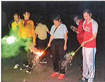
隣の花火が気になります