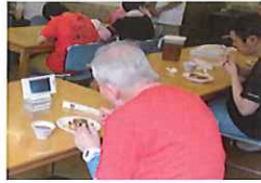
まだまだ食べれるよ!