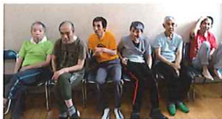
会食の後は、お楽しみ会 今日はカラオケです♪ 順番が待ち遠しい～