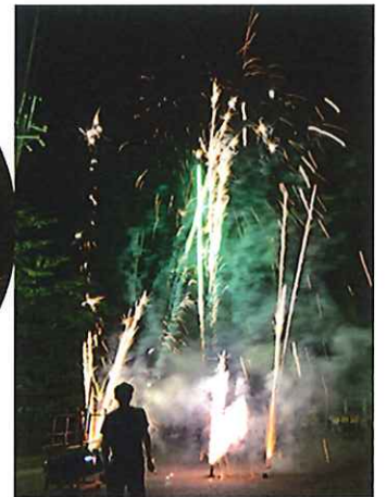
フィナーレの打ち上げ花火☆ 来年もお楽しみに