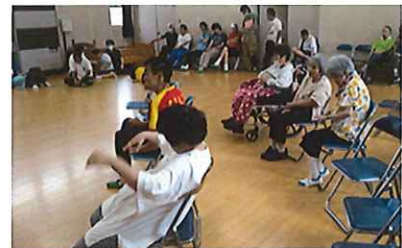
曲に合わせて体が動きます！

【応募方法】 表記住所に郵送、またはメールでお送りください。又は事務所までお越しください。