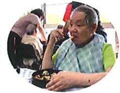
ユニット皆さんも この日は食堂でいただきます