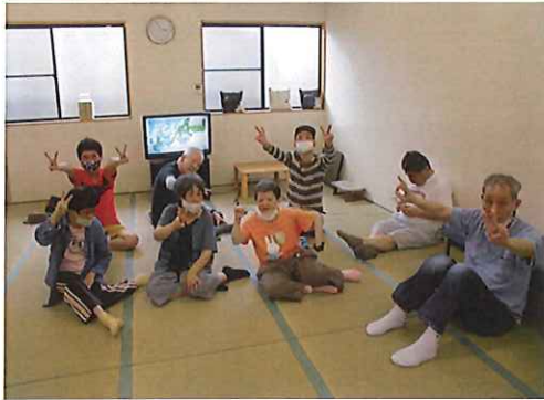
ヤマト憩いの場に、新しい畳が入りました。気持ちいいよ~!