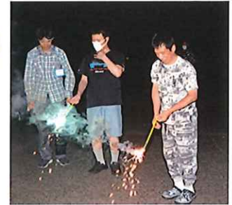
少し緊張してます