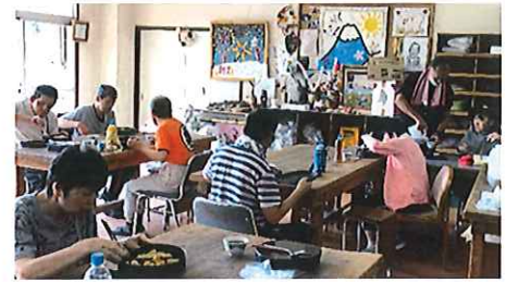
和紙班は和紙室で食べました

作業班ごとにいつもとは違う場所でお弁当を食べました。この日のメニューは、大好きな「とんかつ」でした(o^-^o)