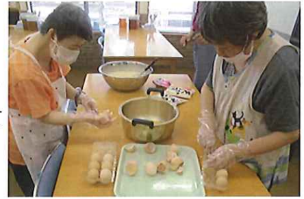
卵の殻を入れないようにそーっとね