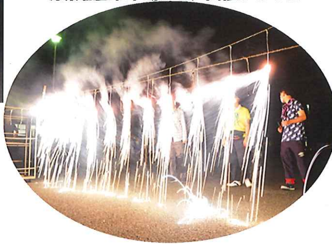
ナイアガラ! 今年は大成功!!