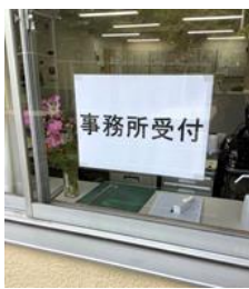
事務所受付を建物の外に一時移動しました。