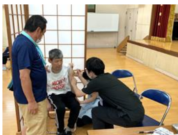
先生と、看護師、支援員の皆さんに見守られ、無事接種終了です。