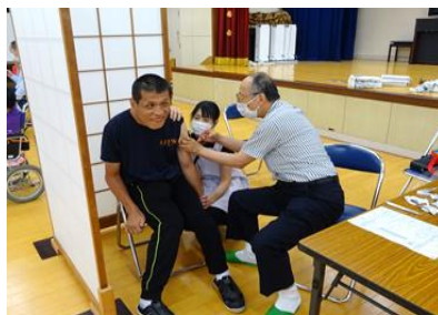
2回目は少し慣れて、表情にも余裕が出てきました。