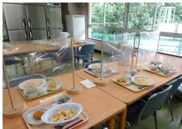
食堂にパーテーションを設置しました。