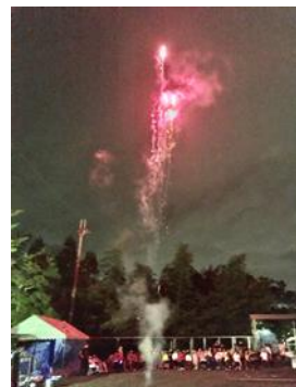
赤色打ち上げ花火も、 高く上がりました！