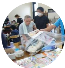
欲しいものが買えたようです。 みんな嬉しそう♪