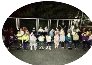
みんなで記念撮影☺