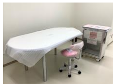
静養室備品を追加で購入しました