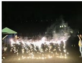
ナイアガラ滝！大成功！ 綺麗ですね！