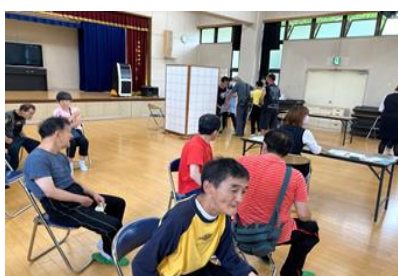
接種後は、密を避けながら静かに決められた時間まで待機です。

主治医であるやわらぎクリニックの先生に 来園頂き六十五歳以下の利用者さんのワクチン接種がおこなわれました。 みなさん少し緊張されながらも、先生の指示のもと無事に接種を終えられました。