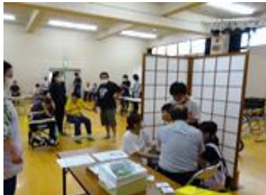
順番を待っているあいだは、少し緊張しています。