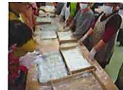
お手伝いし て下さった 方々ありが とうござい ました。