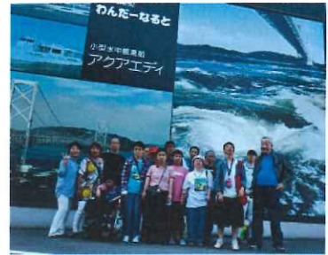
朝八時出発 といつ もより 一時間 以上早 の準備 万端で 予定通

数日前の天気予報では雨天の予報になっており、天候が心配されましたが、日頃の行いが良いのか快晴で暑い朝を迎えました。