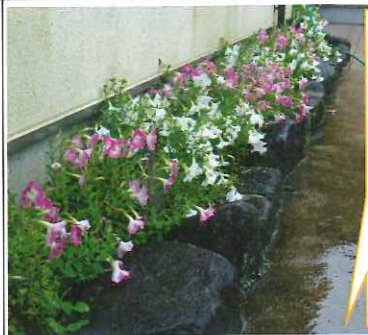
株式会社農業公園 信貴山のどか村様よりご寄贈頂 きました！