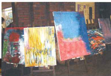
当番で一日二名の利用者が、来場者にあいさつをさ

アンケートも記入していただきましたが、その中の感想を紹介致します。「細かな手作業の作品が多数あり感動しました。」「書道や絵画なども素晴らしい。」「一点一点どれを取っても個性があり素晴らしい。」「力作ばかりで感動しました。ありがとうございます。」「また機会があれば寄せてもらいたいです。」「などの言葉をいただきました。これからもできる限り色々な作品を作っていきたいと思えます。