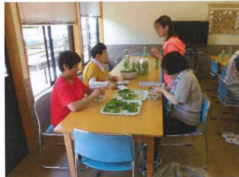
下準備も楽しい作業♪