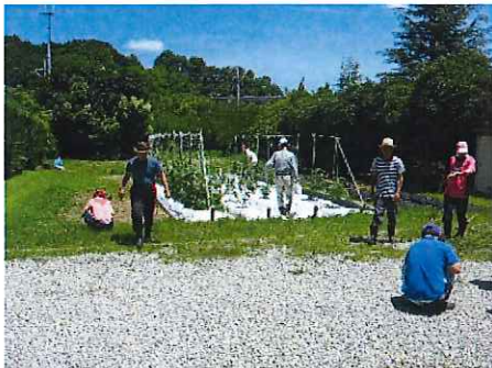
水やりや草引きなど毎日の手入れの様子です。 色々な種類の野菜を育てています。

又、夏野菜の植え付けも行いました。収穫作業はやはり自分達で育てた野菜ができた喜びが味わえるためか利用者のかたも張り切って作業に参加しています。これから夏野菜が大きく育ってくるのが待ち遠しいですね。