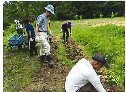
野菜の収穫の様子です。今年も立派なじゃがいもがたくさん収穫できました!!