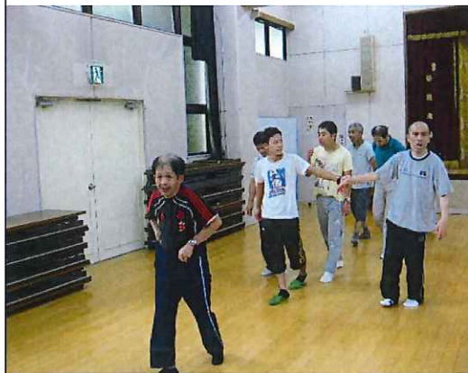
雨の日には交流ホームでウォーキングをします。

TEL 0745-32-4331 FAX 0745-32-4980 MAIL manyu@themis.ocn.ne.jp