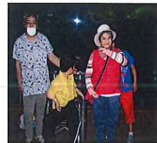
大きな水槽の前で撮りました！！

水族館では珍しい魚を見て回って水槽の前で写真を撮ったりもしています。お目当てのお土産も買って帰り、少し疲れた様子もありましたが、皆少し日焼けした良い表情で「また行きたいな」と笑顔を見せていました。