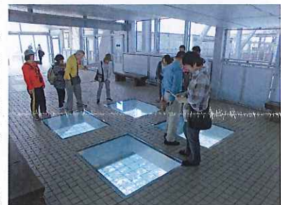
中を覗くと渦がいっぱいまいていましたよ

「渦の道」では足元がガラス張りになっており渦潮の真上に立つ事ができ迫力満点でした。昼食は海の見える場所で会席料理をいただき、食後には特産物鳴門金時のソフトクリームをデザートにいただきました。無事に帰った次の日、思い出話に花が咲きみんないい顔で仕事に取り組んでいました。