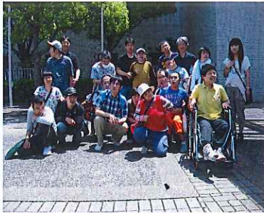
みんなで記念撮影！！

平成二十六年五月二十八日、みどり園バスツアーで須磨海浜水族園に行ってきました。みどり園だけでのバスツアーは今回が初めてで、不安もありましたが天気にも恵まれ皆、晴々とした表情でバスに乗り込みました。バスの中でも皆さんにぎやかに過ごしておられ、「このお店、前に来たことあるねん。」等と、窓の外を見て楽しそうに話しておられました。