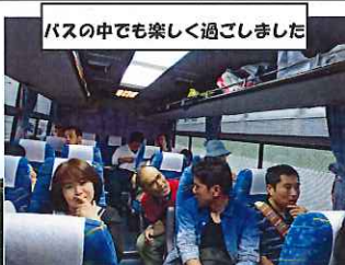
バスの中でも楽しく過ごしました