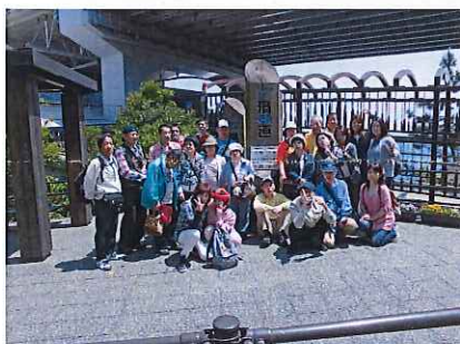
全員集合で「ハイ、チーズ！！」

「渦の道」では足元がガラス張りになっており渦潮の真上に立つ事ができ迫力満点でした。昼食は海の見える場所で会席料理をいただき、食後には特産物鳴門金時のソフトクリームをデザートにいただきました。無事に帰った次の日、思い出話に花が咲きみんないい顔で仕事に取り組んでいました。