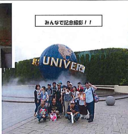
みんなで記念撮影!!