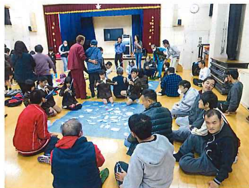
小学生とゲームを楽しむ

園内に元気な声が響き賑やかな三日間になりました。後日、お礼のお手紙をいただきありがとうございました。