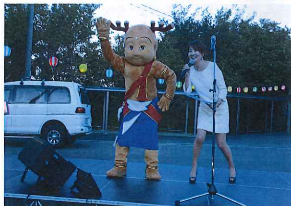
せんとくんあいさつ