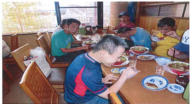
天理ラーメン本店

晴天の空の下、公園にて全員で記念写真を撮りました。そして、天理のラーメン屋さんに着き食事をしました。全員美味しく食べ満足そうでした。帰りは車中にて、全員で缶コーヒを飲んで帰り半日外出が終わりました。また九月には、園遊会、十月には一泊旅行があり、これから楽しみがいっぱい