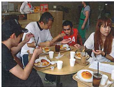
ハートランド喫茶室

いろは園のドンキーへの外出でしたが、今まで行ってなかったところにも行ってみようということになりました。初めての場所での飲食という事で少し落ち着かない様子の方もおられました。たがすぐに慣れ、笑顔で楽しんで飲食されていました。ホットケーキやカレーパン、アイスコーヒを注文されている人が多く、どれも皆、美味しそうに食べておられました。帰りのバスの中では、「美味しかったなあ」、「また行きたいなあ」という声飛び交っていました。