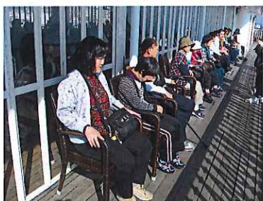
ミシガン船上にて

旅行当日、園を出発して二時間半程バスに乗り、嵐山渡月橋という所で昼食を食べて、その後京都水族館でいろんな魚やイルカのショーを見ました。そして雄琴温泉へ向かい、温泉に入り宴会をしました。おいしいご飯を食べ、みんなでカラオケをしてとても楽しい一日目が終わりました。二日目にはミシガンショーボートに乗り、その後昼食を食べ、井筒八ッ橋本舗でおいしい八ッ橋の試食を頂き、それぞれお土産も買いました。園に帰ってからもどんなおいしいものを食べたのか、宴会ではどんな歌を歌ったのかなど、旅行の思い出をたくさん話してくれました。とても楽しい一泊旅行でした。