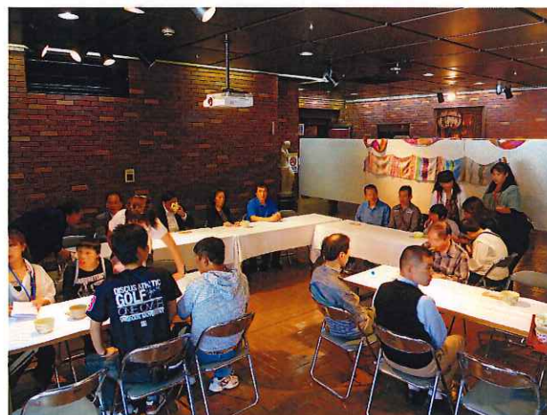
利用者もお客さんも、美味しいお抹茶と お茶菓子をいただきました