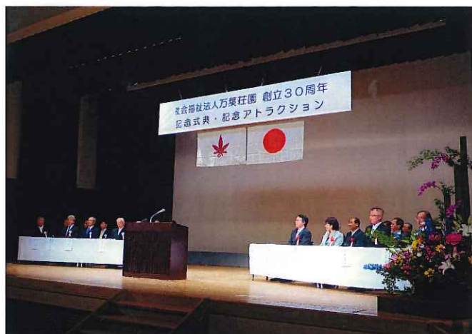
記念式典が開幕 来賓の方もたくさん来ていただきました