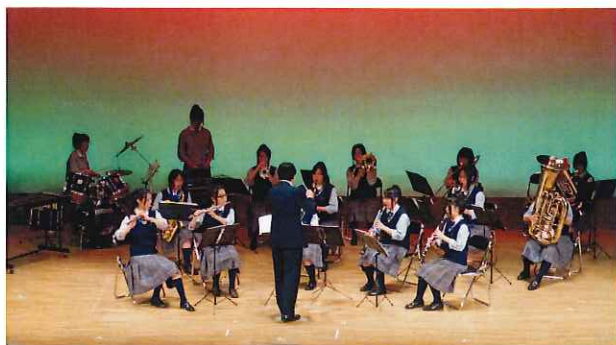
西和清陵高校 吹奏楽部の 皆さんによる演奏♪