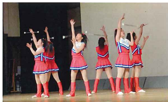
西和清陵高校 バトン部の 皆さんによるダンス☆