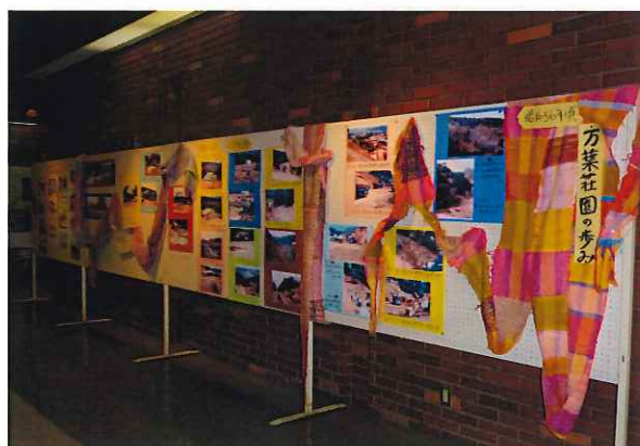
ロビーには 万葉荘園の歩みや 各年代の 利用者の集合写真を展示しました