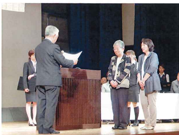
手芸・アートフラワー・織物の ボランティアの方々へ 日頃の感謝を込めて 感謝状と記念品が贈られました