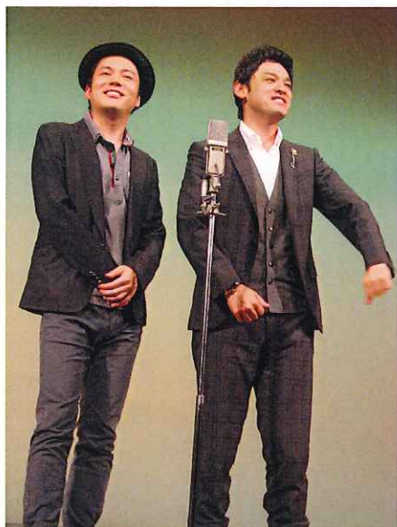
シャンプーハットの漫才に…