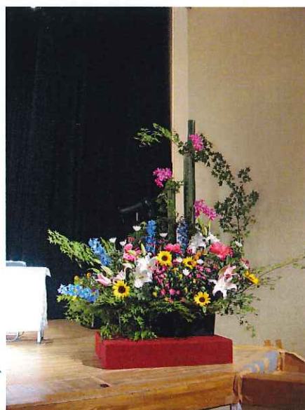
壇上の生花は 華道教室の 安井先生が生け込みして 下さいました