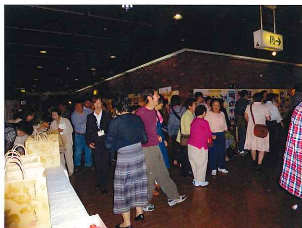
楽しかったね～ 帰ったらおやつだ！