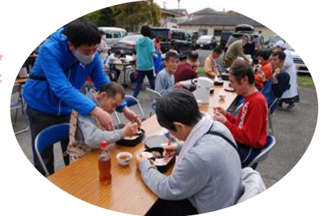
食べるのも真剣です。

今年は、例年より桜の開花が早く、散り始めてしまいましたが、皆で園の桜を見ながら外でお弁当を食べました。