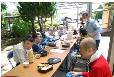
お弁当早く食べたいなあ～