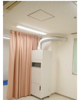
陰圧装置(2台)補助金を頂き設置