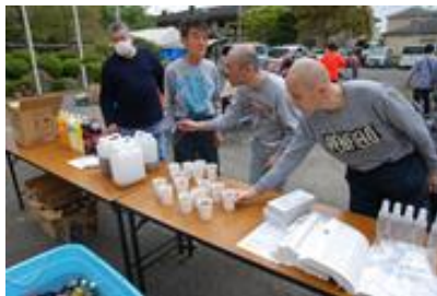
ドリンクバーです。 好きな飲み物を選んでます。