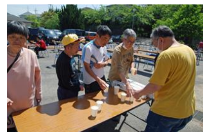
「コーヒー下さい。」「僕はコーラ！！」