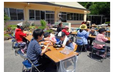
皆で食べるお弁当、美味しかった～