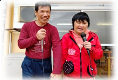
仲良くデュエット カラオケも盛り上がりました。