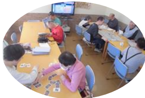
トランプをしたり、お喋りをしたりして楽しんでおられます