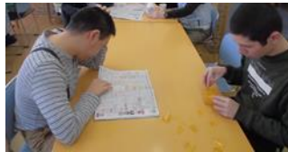
テレビ番組表をチェック!