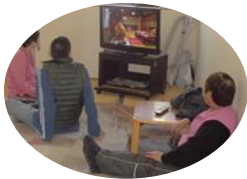
NHK 朝の連続テレビ小説見入っています。