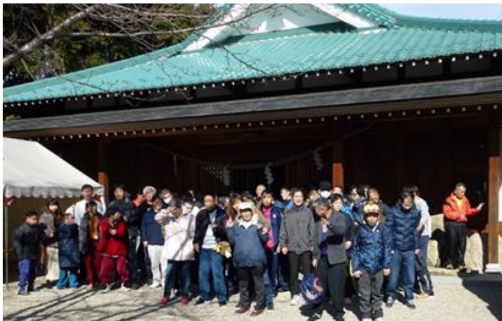
最後に皆で記念写真！ハイ、チーズ！

例年より少し遅くなりましたが、天気も良く元気に歩いて向かった利用者と、車で向かった利用者、みどり園、ヤマトの方々と合流して御祈禱して頂きました。今年も良い年になりますように。